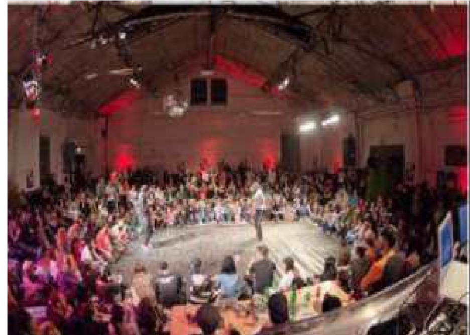
Informe si l'aforament és superior a 500 persona