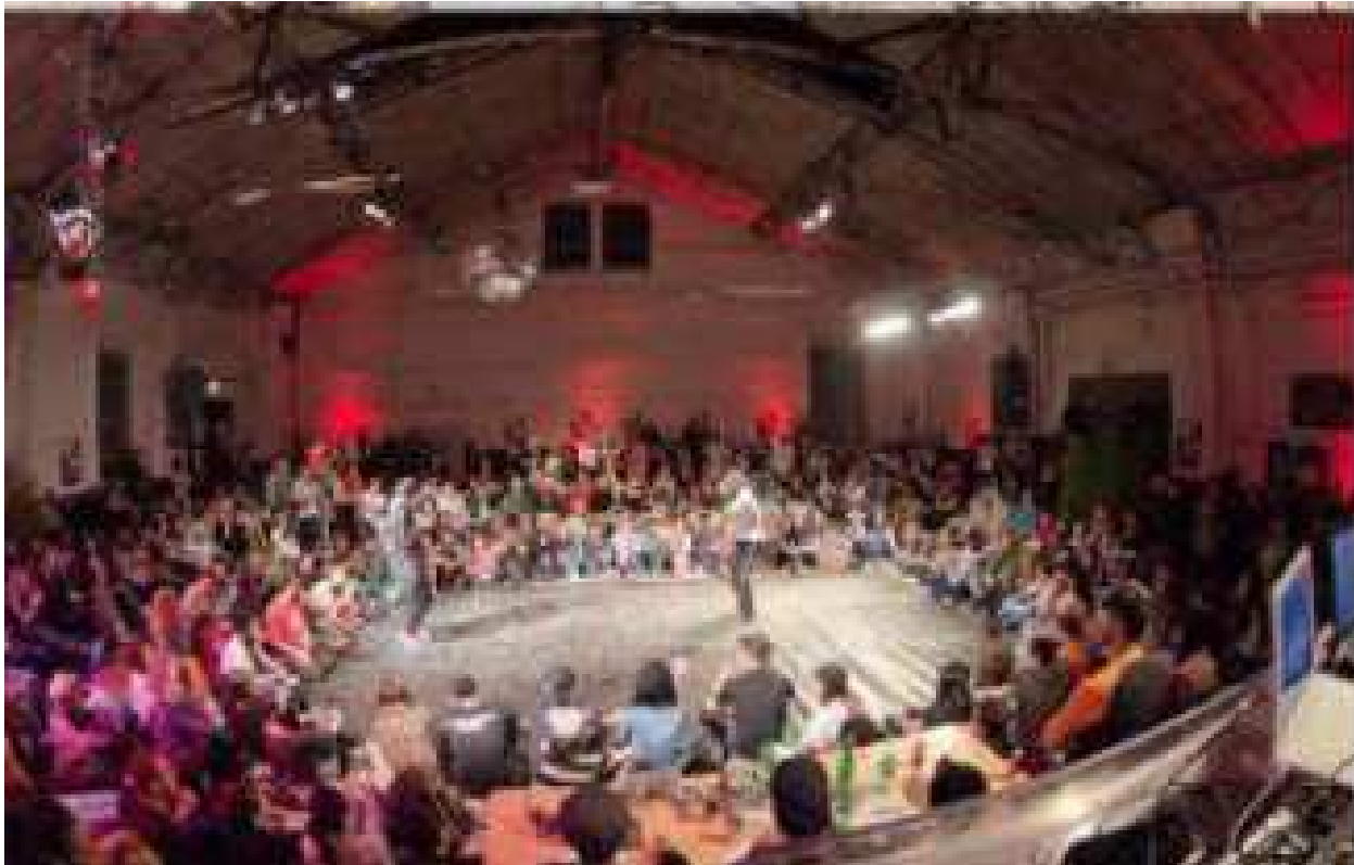
Nau industrial reconvertida en local d'espectacles