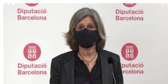
La vicepresidenta, Carmela Fortuny

"En definitiva, el Catàleg de Serveis s'ofereix als ajuntaments i està orientat a la recuperació i la reactivació econòmica i també social", ha conclòs la vicepresidenta.