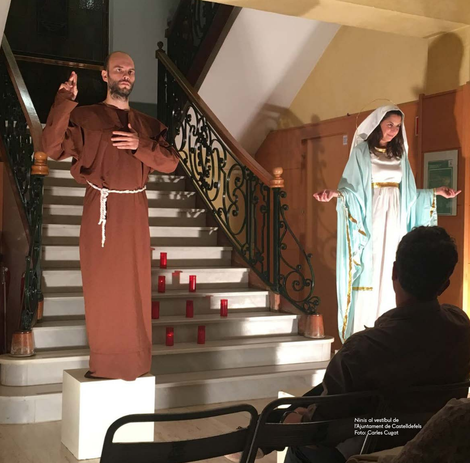
Ninis al vestíbul de l'Ajuntament de Castelldefels