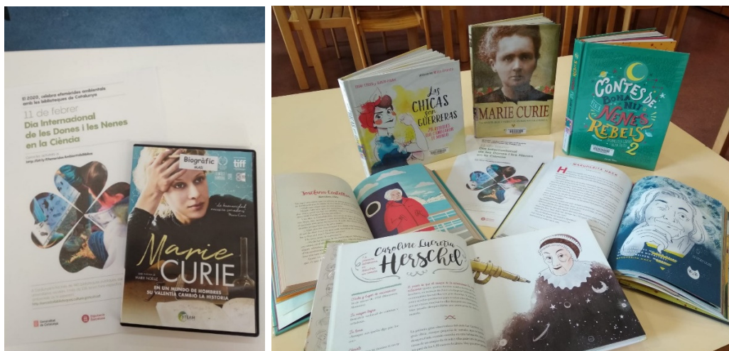
Exposició documental pel Dia Internacional de les Dones i les Nenes en la Ciència