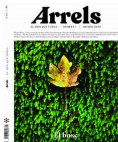
Recomanacions Prestatge virtual