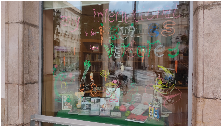
Aparador/Exposició de fons Any Internacional de les Fruites i verdures