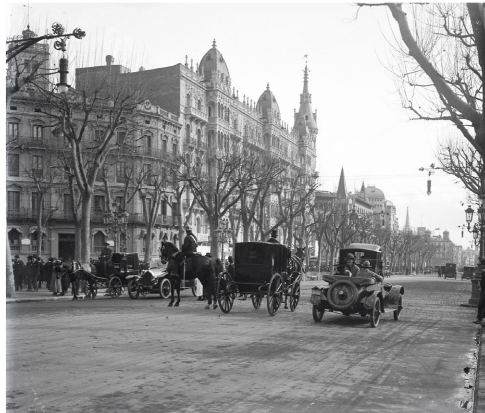
Frederic Juandó Alegret. ca. 1925

Espectacle ambulat de la cabra equilibrista al Portal de la Pau de Barcelona. A la dreta, les drassanes, i al fons, les xemeneies del Poble-sec.