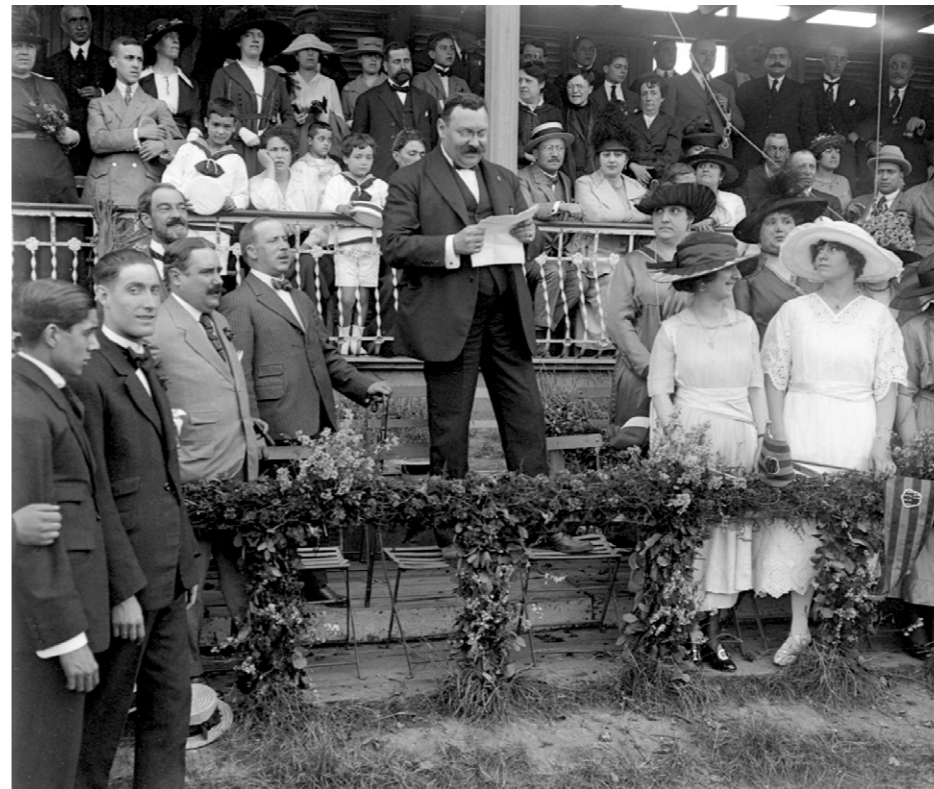
23 de juny de 1918

Joan Gamper fent un discurs al camp de futbol del FC Barcelona del carrer Indústria, amb motiu de la Festa de la Bandera.