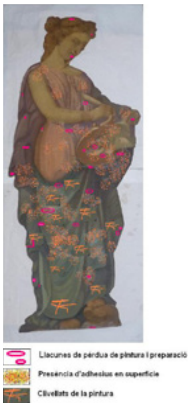
Figura 5. Documentació tècnica de les alteracions.