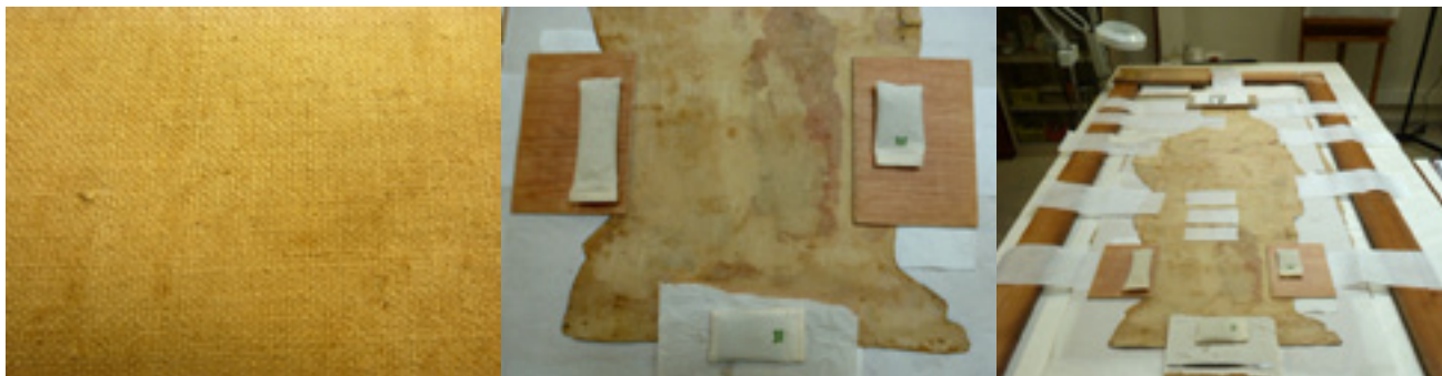
Figures 9-11. Procés d'estabilització i de consolidació del suport. Es van eliminar les restes adherides pel revers i es van col·locar bandes de tensió provisionals fixades al bastidor. Posteriorment es va aplicar adhesiu Beva en gel pel revers, abans del reentelat.