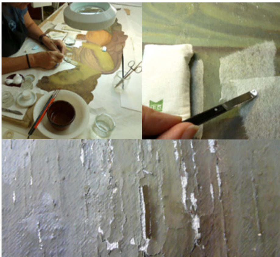
Figures 6-8. Fases de la fixació i de la protecció de la capa pictòrica.

veure la textura de la trama de la tela. En la seva aplicació s'alternen zones que formen una pel·lícula bastant prima, fonent els colors, i altres amb pinzellades més denses i expressives. La paleta de colors és en general austera, amb predomini de verds, ocres i tons terrosos.