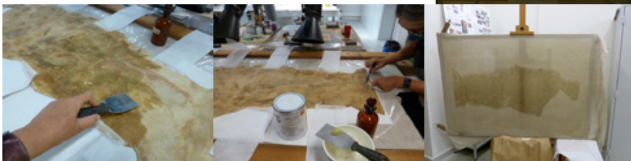
Figures 12-14. Imprimació de la nova tela de lli de reforç amb Plexisol i aplicació de la capa d'adhesiu Beva pel reentelat.