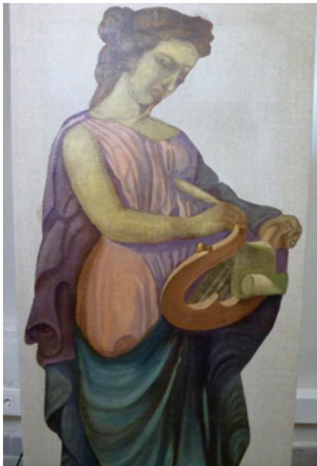
Figura 19. Reintegració pictòrica de les petites pèrdues amb aquarel·les per a la base de color i amb pigments aglutinats en vernís de retoc per a les veladures finals.