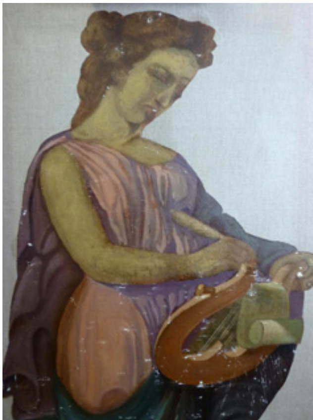
Figura 18. Anivellat de les llacunes de pèrdua de la pintura. El desnivell es va reomplir amb un estuc sintètic.