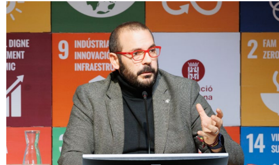
David Bote Paz , alcalde de Mataró.